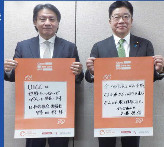
Close the care Gap メッセージ

2月4日の夜空をブルーとオレンジの光に包むライトアップが、世界各地で行われます。コロナ禍で、人と人の距離を離さなければならないいま、距離を超えて、日本各地の光を繋ぎ、未来にむけてがんという病への想いをひとつにする瞬間をともに分かち合いましょう。