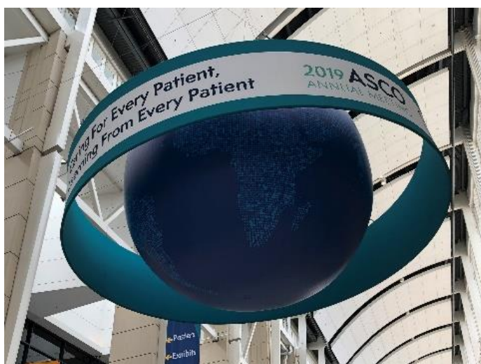
■写真2：総会テーマが掲げられたメイン広場のオブジェ

ところが、総会3日目のプレナリー・セッション（優秀演題）の1題目の発表を聞いたあと、この日本ではおおよそ「当たり前」なことが、今のアメリカの医療では、「当たり前になっていない」ということを改めて認識をし、この総会テーマに込められた言葉の意味をかみしめることになりました。