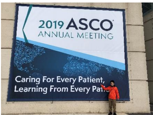
■写真3 総会テーマを掲げた入り口の看板