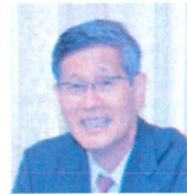
認定NPO 全世代代表理事 尾身茂

医師不足で悩む地域であったのキャリアを生かした第二の人生を歩みませんか。皆様の応募をお待ちしております。