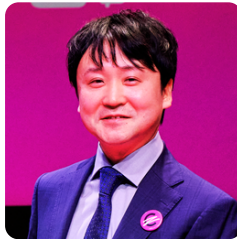
愛知県がんセンター ゲノム医療センター がんゲノム医療室・乳腺科 医長

がん組織からがん治療抗体を見つける！ ～がん患者から未来の臨床応用までバトン を繋ぐ～